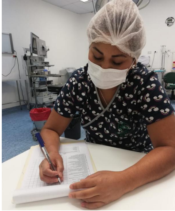
Llenado de planilla de datos del paciente